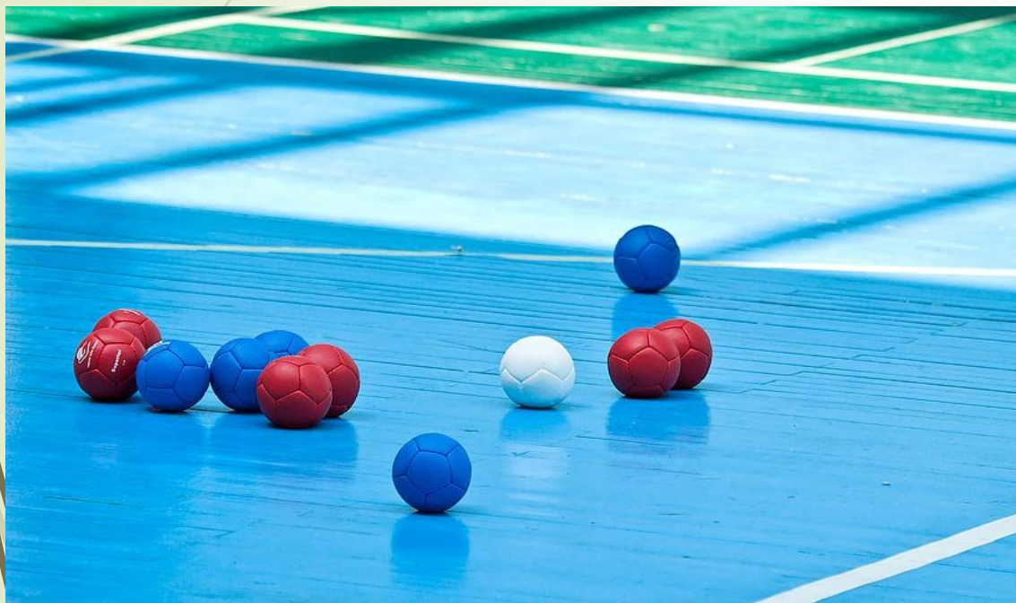
Игра на паркете